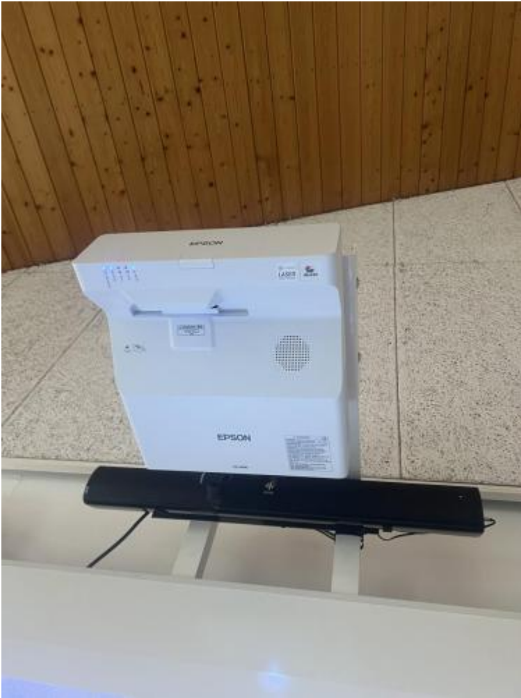
Beamer mit Soundbar