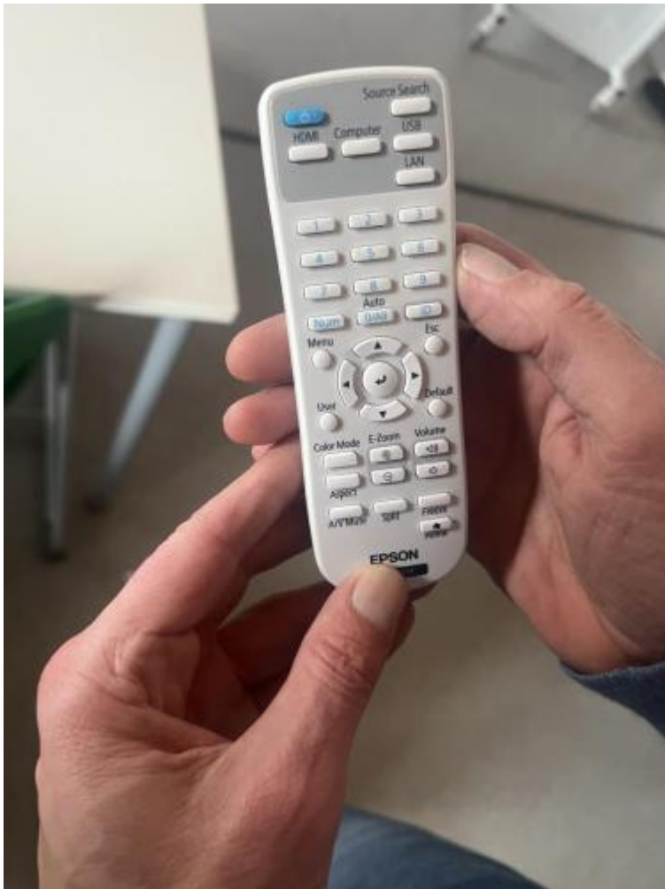
Steuerung des Beamers und der Lautstärke