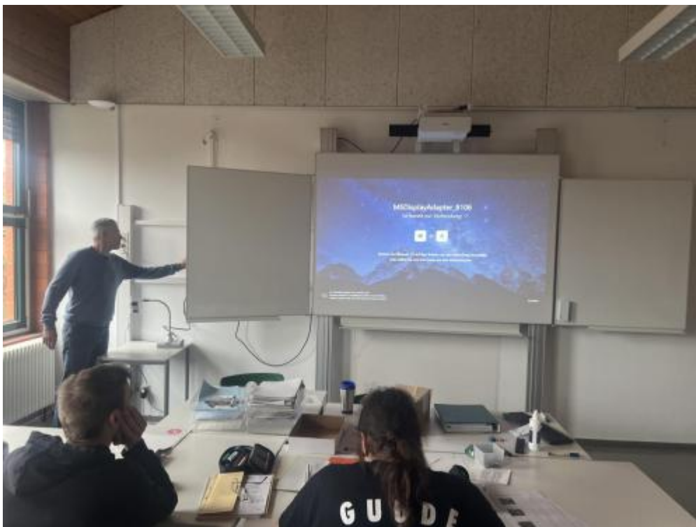
Neues Whiteboard im Unterrichtseinsatz