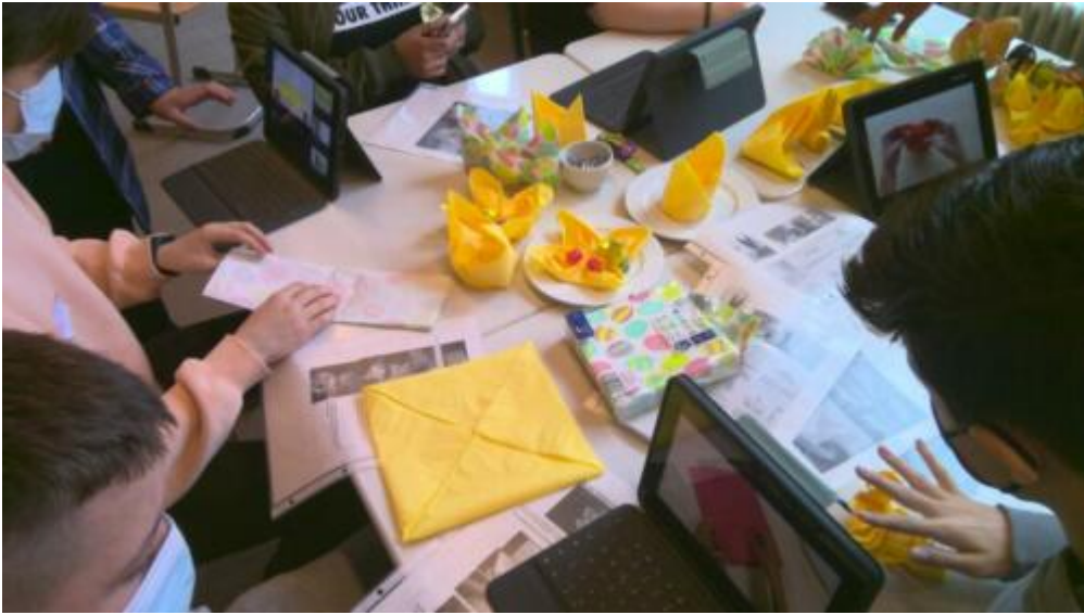
TdB HW 7