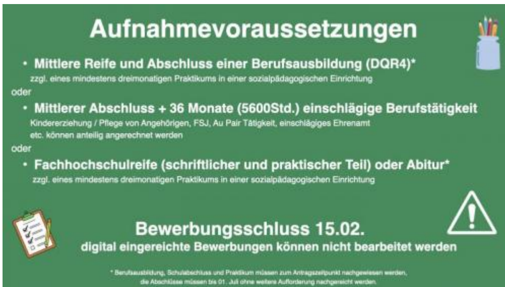
Fachschule für Sozialwesen Sozialpädagogik-2.005