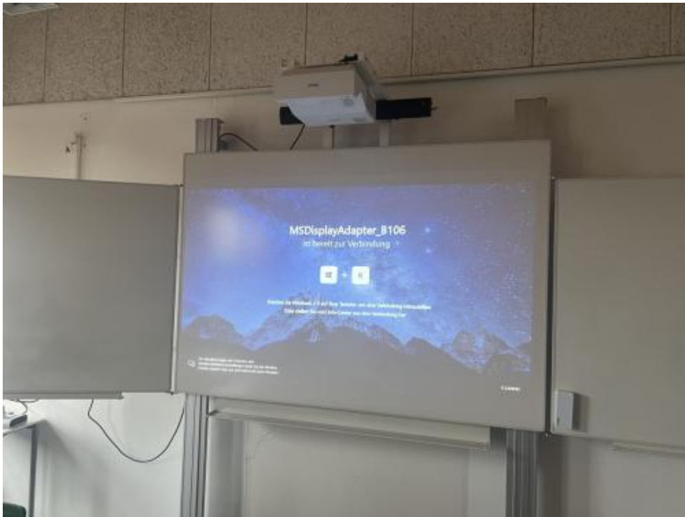
Start des Beamers