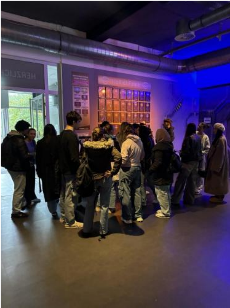
WhatsApp Image 2024-11-27 at 11.16.09