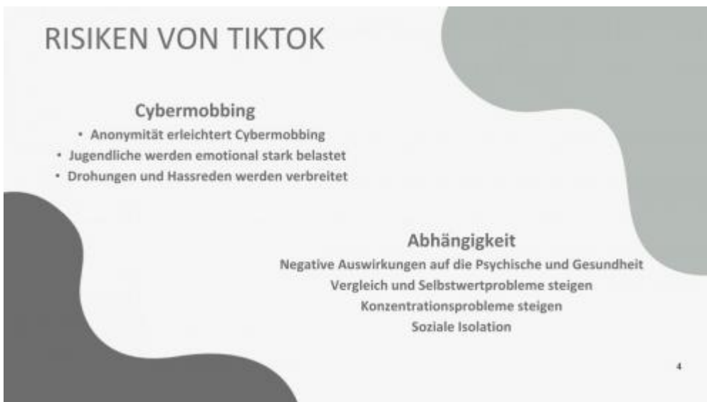
Internet und ihre Gefahren-bilder-3