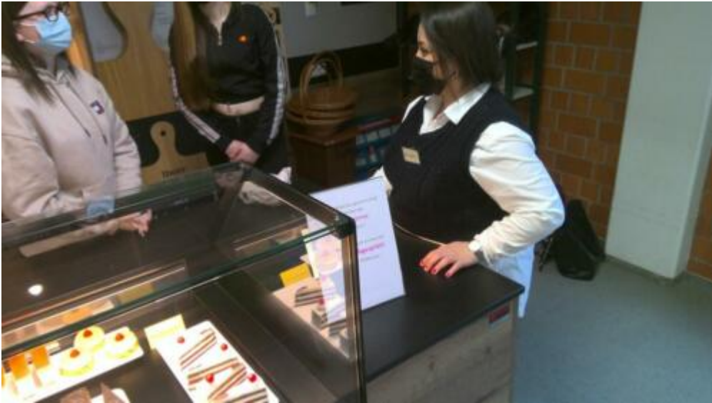
TdB Bäv 11