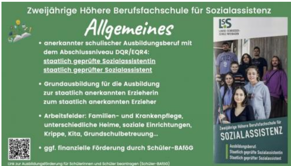
3_Zweijährige Höhere Berufsfachschule für Sozialassistenten