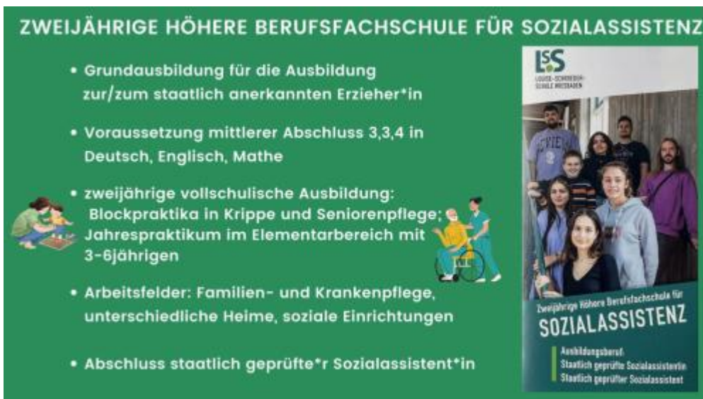
Zweijährige Höhere Berufsfachschule für Sozialassistent