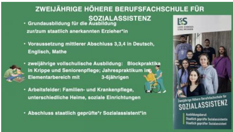
Fachschule für Sozialwesen Sozialpädagogik-2.003