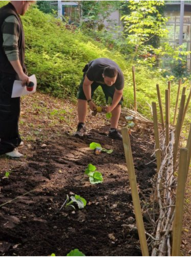
Beet Gebäude BC