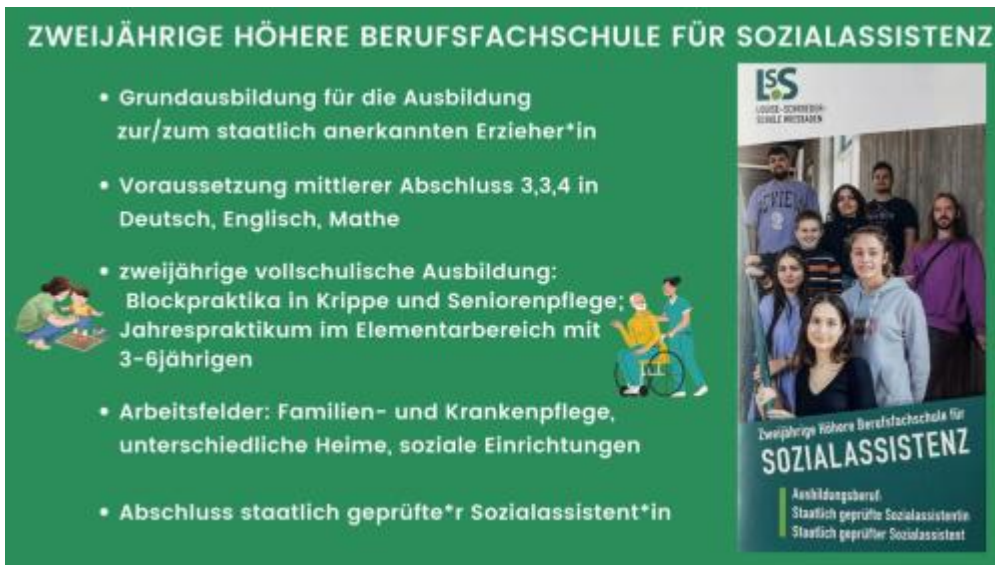
Zweijährige höhere Berufsfachschule für Sozialassistent