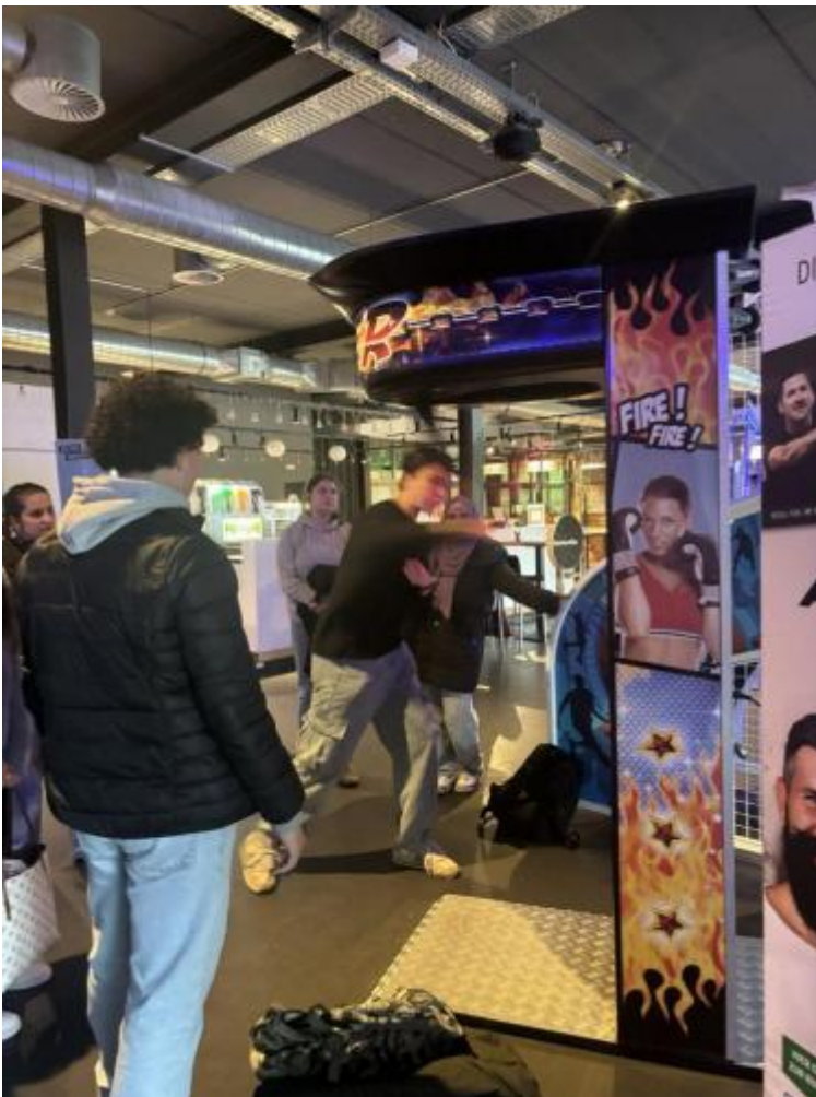
WhatsApp Image 2024-11-27 at 11.16.49