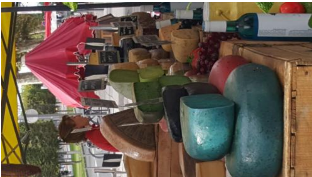
20190927_111310 - Kopie