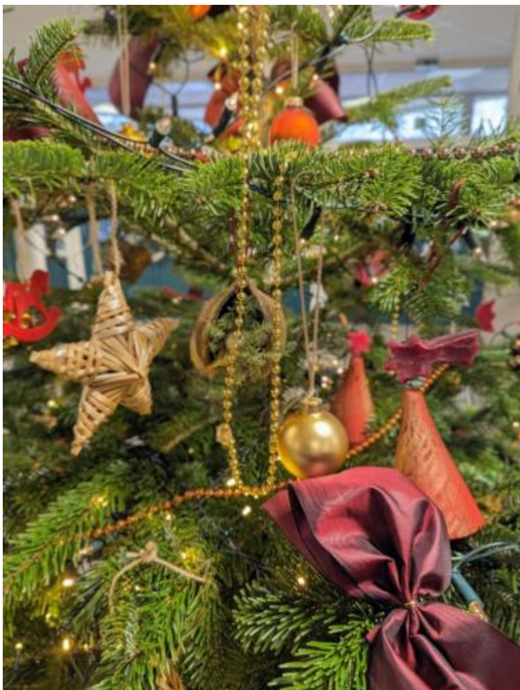
Weihnachtsbaum im Foyer 2023