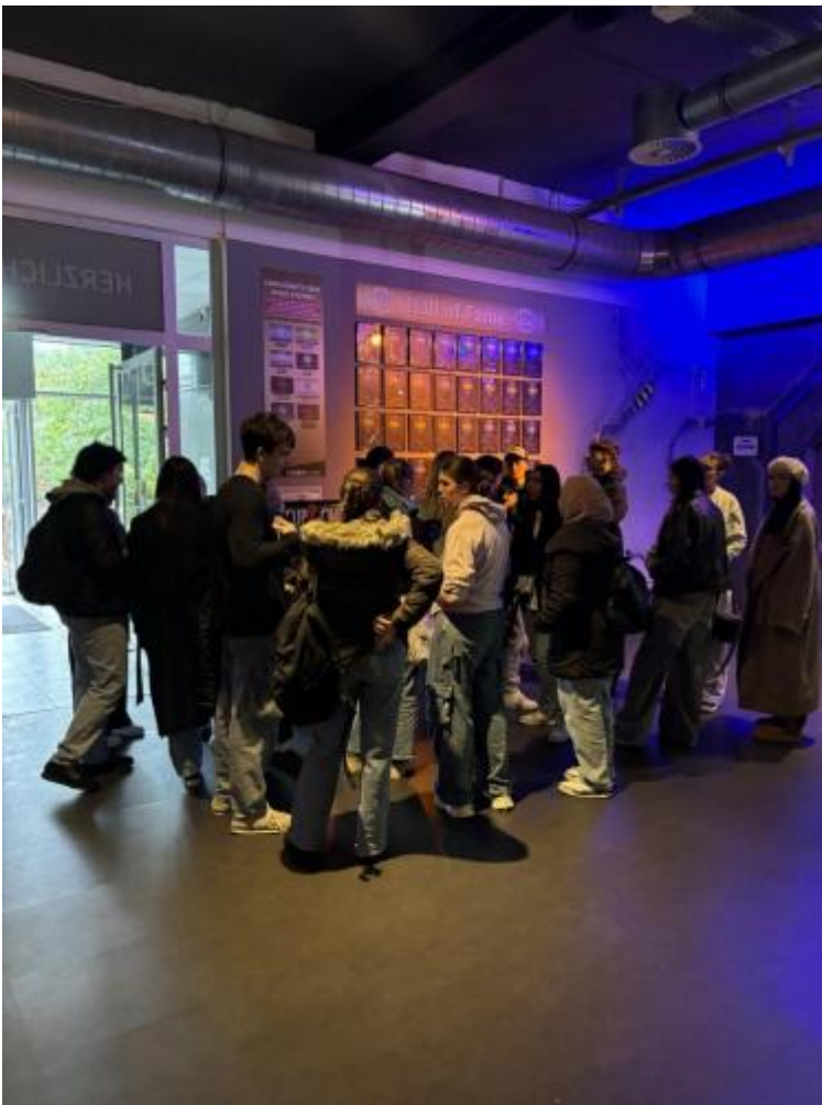
WhatsApp Image 2024-11-27 at 11.17.02