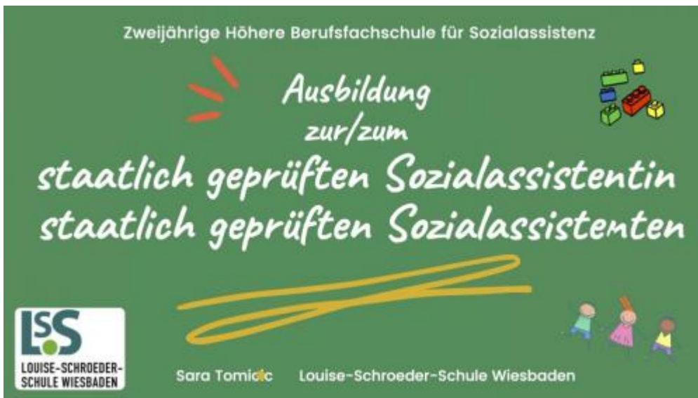
1_Zweijährige Höhere Berufsfachschule für Sozialassistenten