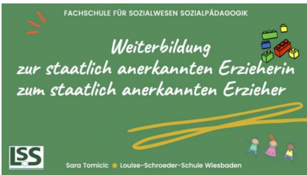
Fachschule für Sozialwesen Sozialpädagogik-2