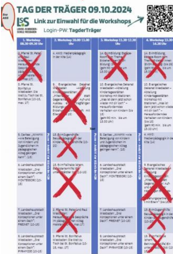
Anmeldung QRLink Tag der Träger