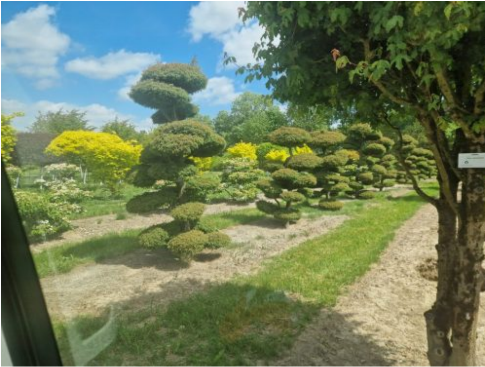
Baumschule LVE 1