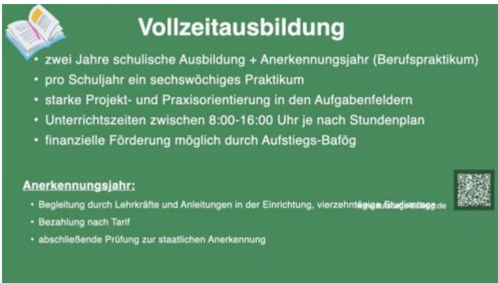
Fachschule für Sozialwesen Sozialpädagogik-2.007