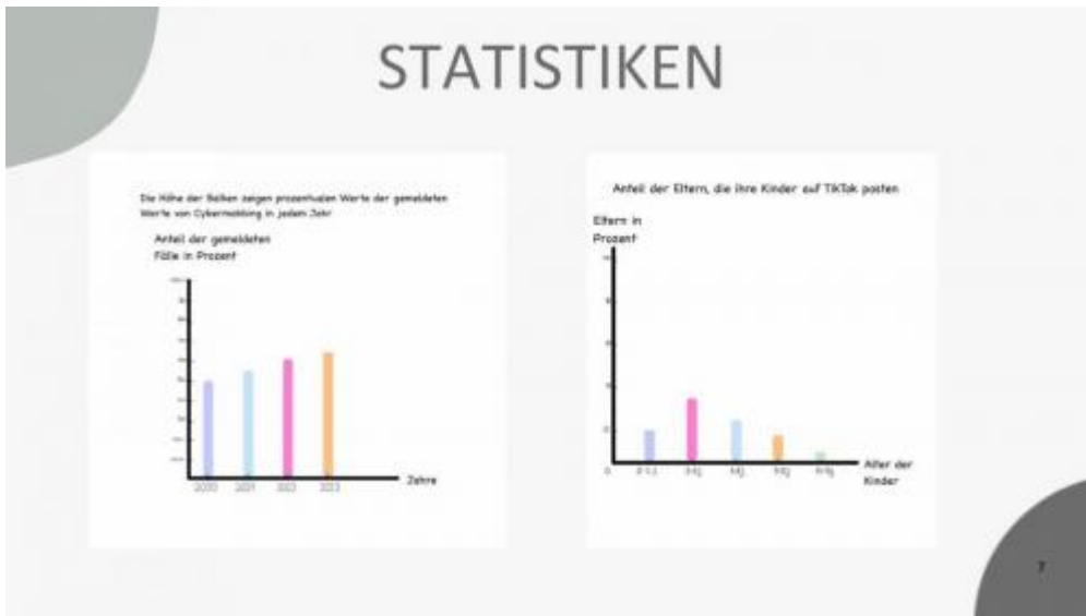
Internet und ihre Gefahren-bilder-6