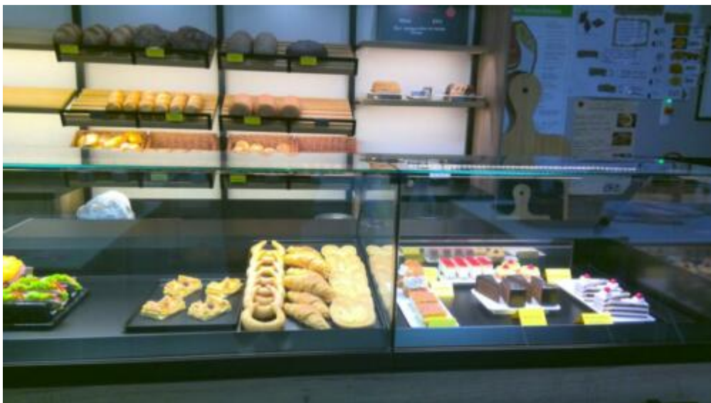
TdB Bäv 3