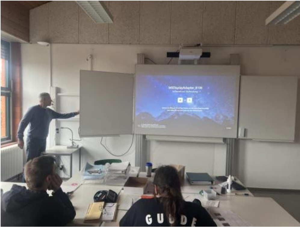
Neues Whiteboard im Unterrichtseinsatz