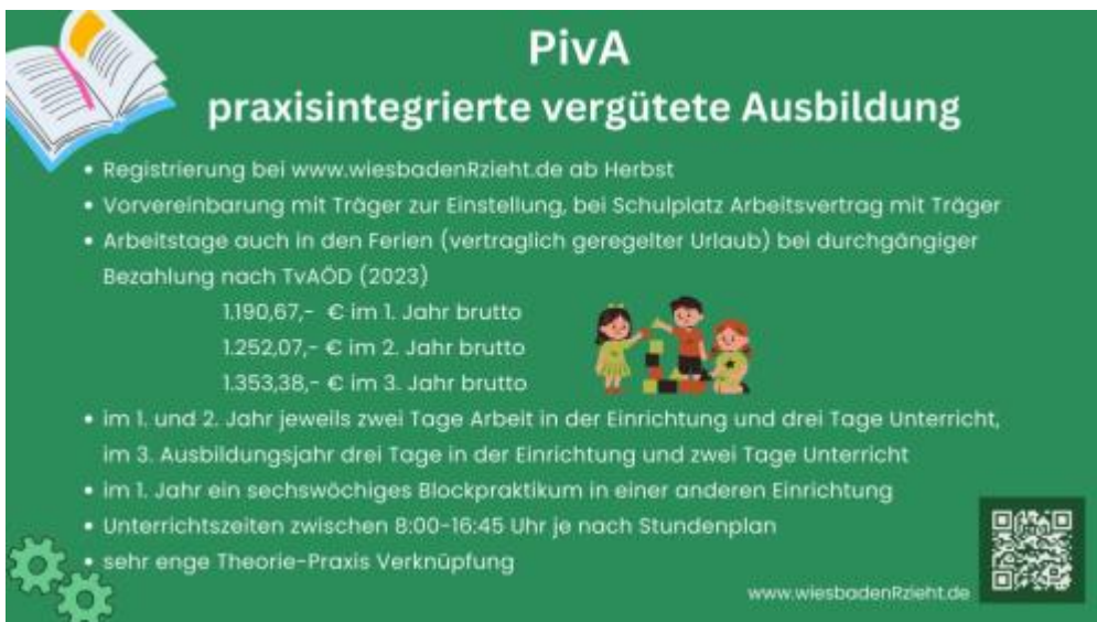
PivA praxisintegrierte vergütete Ausbildung