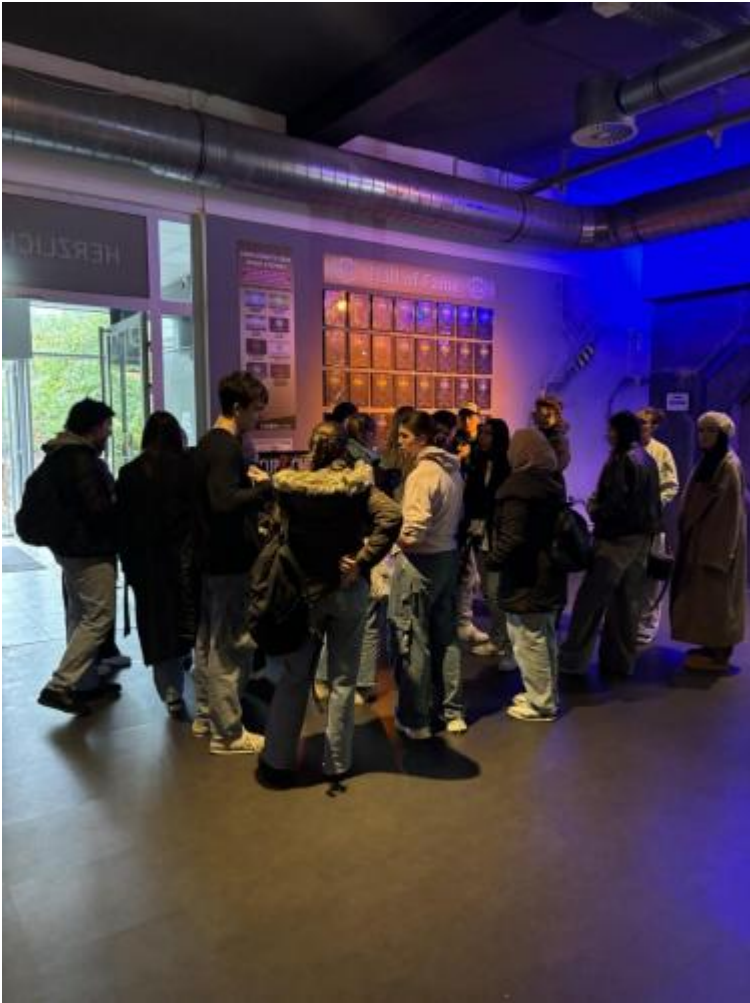
WhatsApp Image 2024-11-27 at 11.17.02