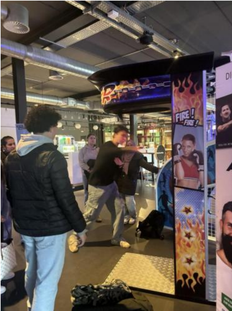
WhatsApp Image 2024-11-27 at 11.16.49