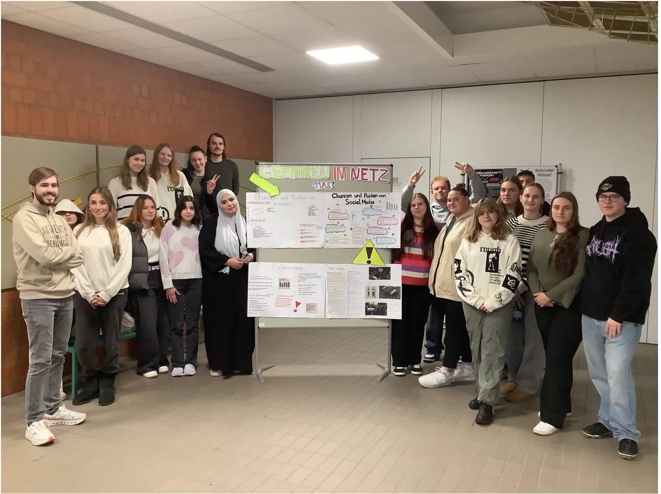
Die Klasse 11AS3 hat zum Thema Gefahren und Chancen im Internet und Social Media Informationsplakate ausgearbeitet und im Foyer ausgestellt.