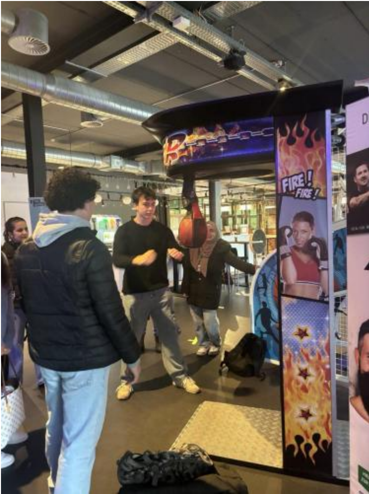
WhatsApp Image 2024-11-27 at 11.16.30