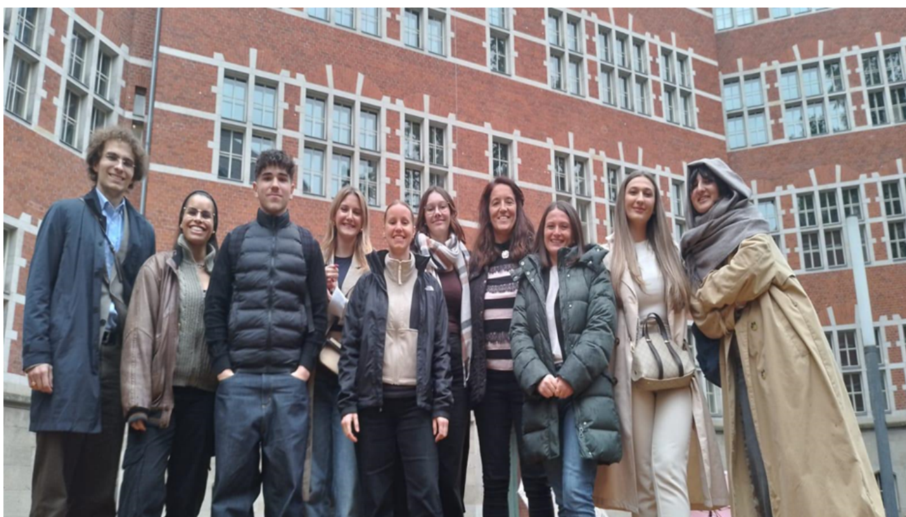
Unsere Gruppe beim Interkulturellen Training in Berlin im Oktober 2024

Wir, die angehenden Erzieherinnen und Erzieher des Wahlpflichtfaches: "Reggio Ansatz in Europa", hatten die Möglichkeit unser zweites pädagogisches Blockpraktikum im Ausland zu absolvieren. Zuvor waren wir vom 01.10.2024 bis zum 03.10.2024 in Berlin, um am interkulturellen Training des ERASMUS+ Programms teilzunehmen, welches in der Jane-Addams-Schule stattfand. Sinn und Zweck des Trainings war es, die wichtigsten interkulturellen Inhalte für unser zukünftiges Auslandspraktikum zu bearbeiten und dieses Training auch zu bestehen, um uns für ein Stipendium zu qualifizieren.