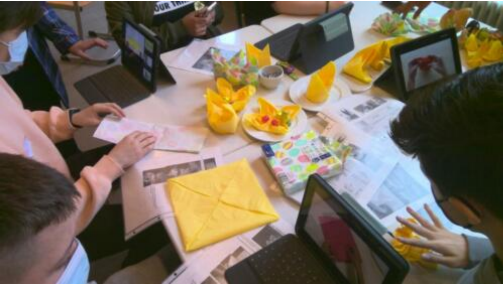
TdB HW 7