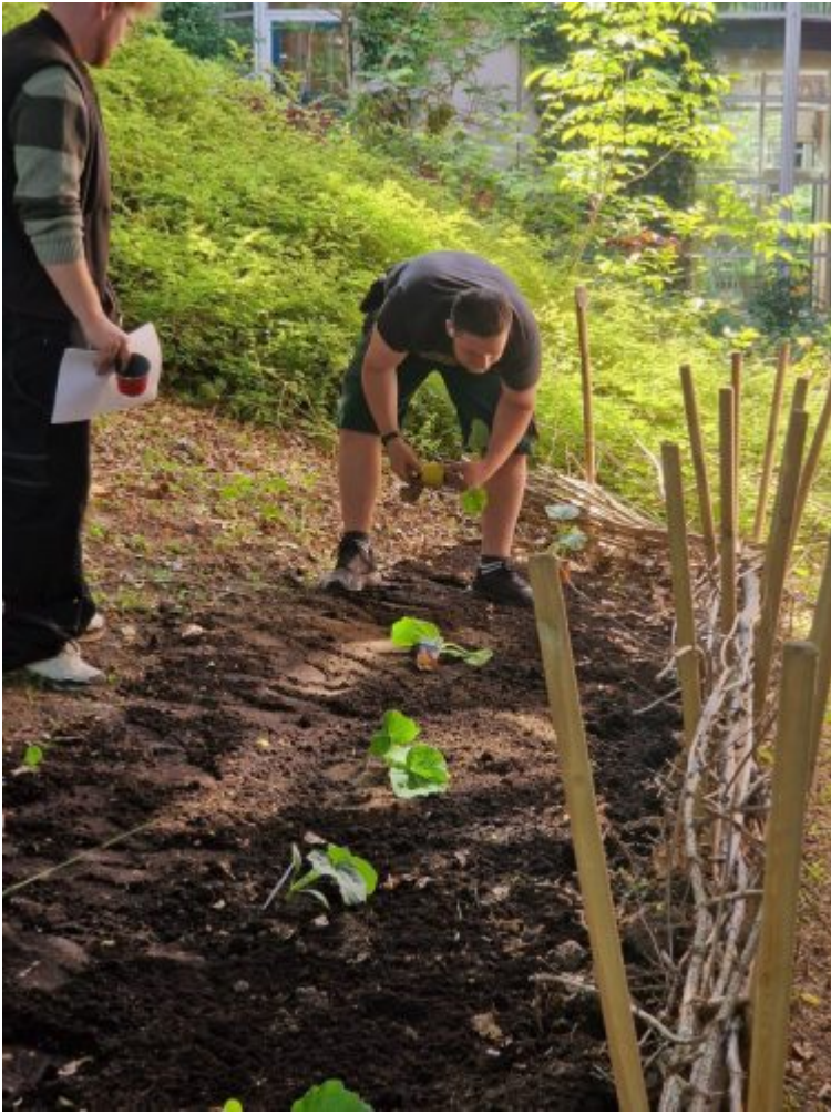
Beet GebNude BC