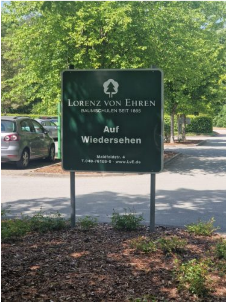
Baumschule LvE 2