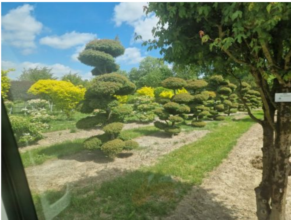
Baumschule LvE 1