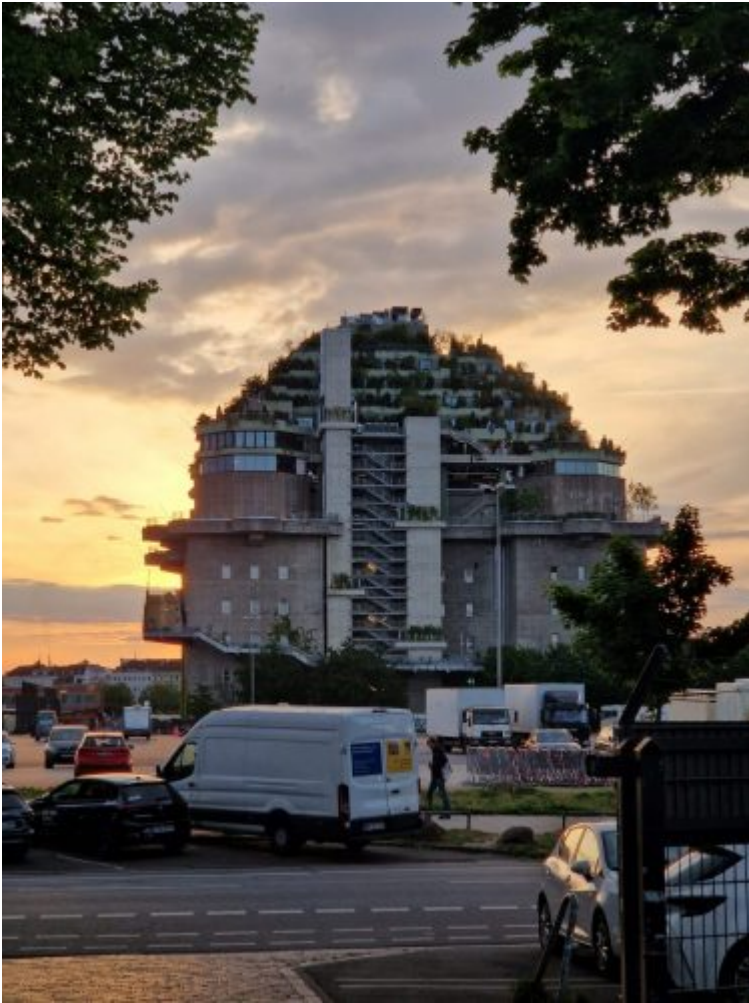
Bunker St. Pauly