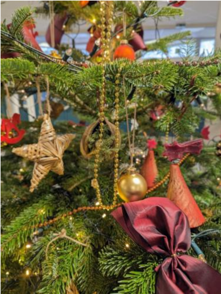
Weihnachtsbaum im Foyer 2023