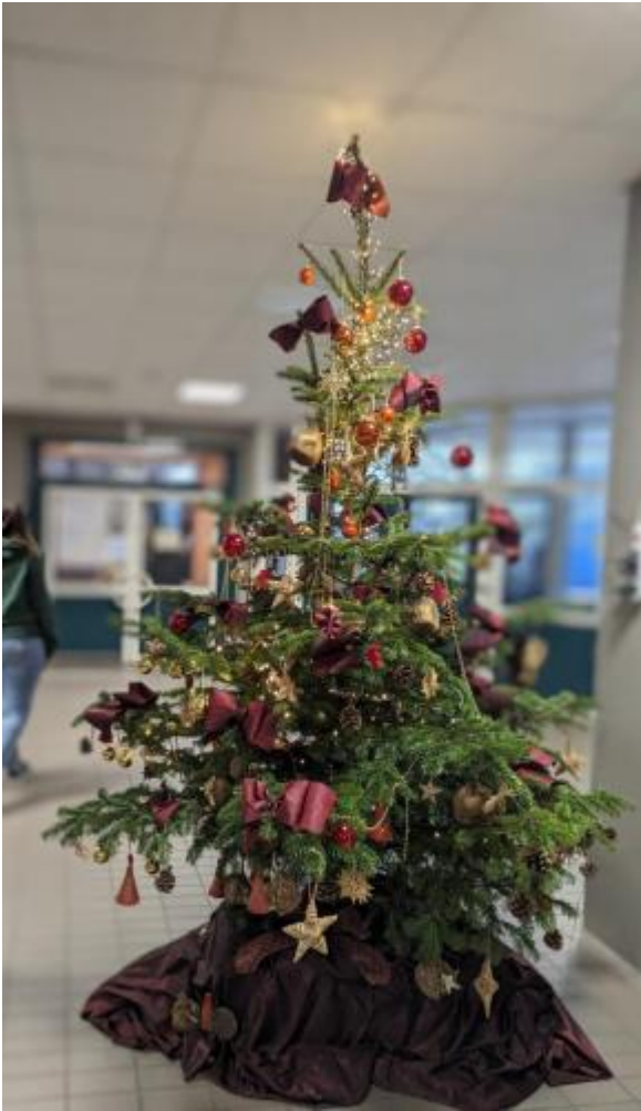
Weihnachtsbaum im Foyer 2023