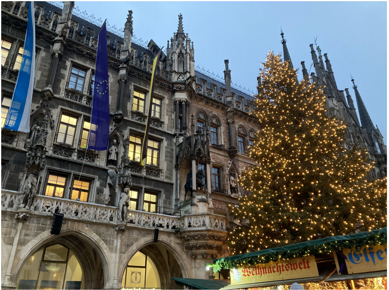
Bericht von der Klassenfahrt nach München 2024